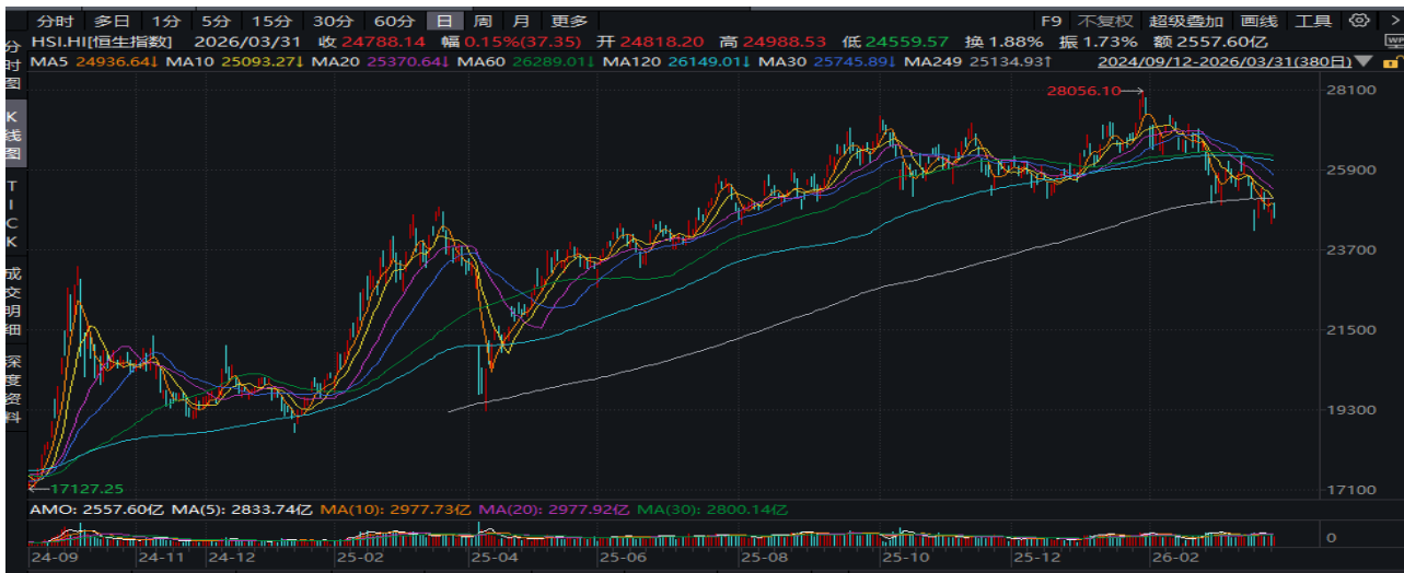
恒生指數日行情 (2024 09 12 - 2026 03 31)

相對於上一個月，2026年3月恆生指數跌6.92%報24788.14點，恆生金融指數跌5.37%報50514.01點，恆生公用事業指數跌4.06%報39558.12點，恆生地產指數跌12.36%報19470.76點，恆生工商業指數跌7.46%報12770.93點，恆生中國企業指數跌5.48%報8374.30點，恆生科技指數跌9.5%報4649.82點。