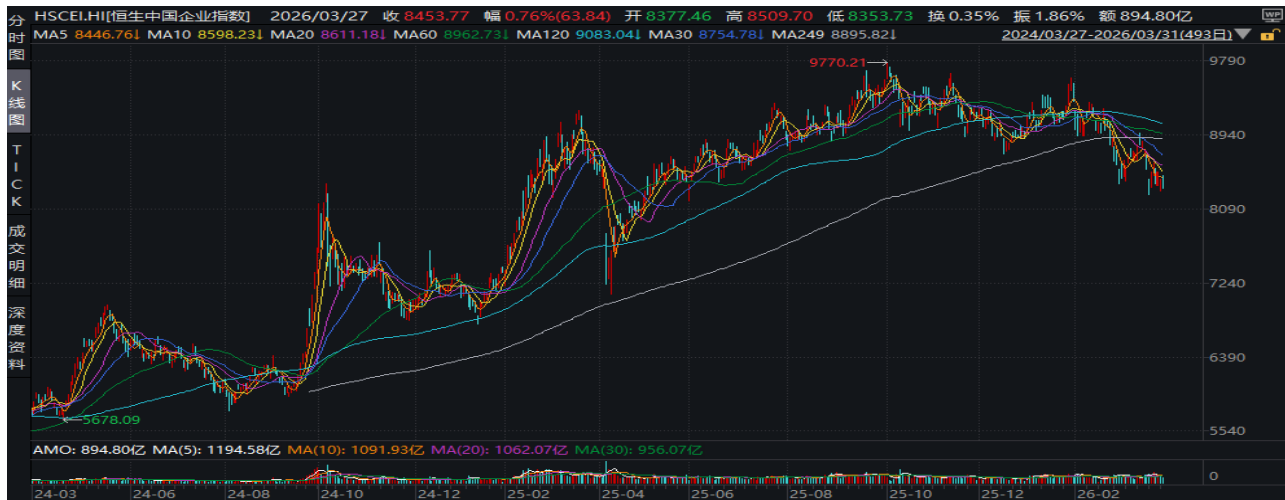
恒生中國企業指數日行情 (2024 03 27 - 2026 03 31)