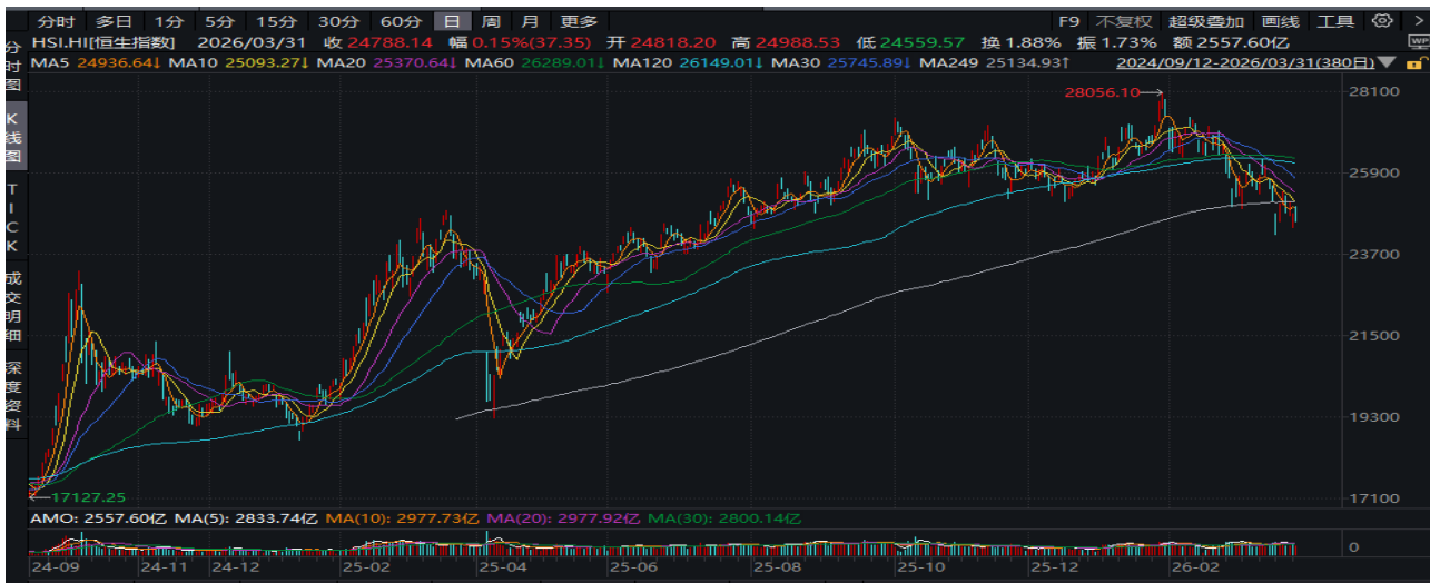
恒生指数日行情 (2024 09 12 - 2026 03 31)

相对于上一个月，2026年3月恒生指数跌6.92%报24788.14点，恒生金融指数跌5.37%报50514.01点，恒生公用事业指数跌4.06%报39558.12点，恒生地产指数跌12.36%报19470.76点，恒生工商业指数跌7.46%报12770.93点，恒生中国企业指数跌5.48%报8374.30点，恒生科技指数跌9.5%报4649.82点。