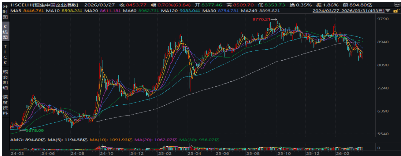
恒生中国企业指数日行情 (2024 03 27 - 2026 03 31)