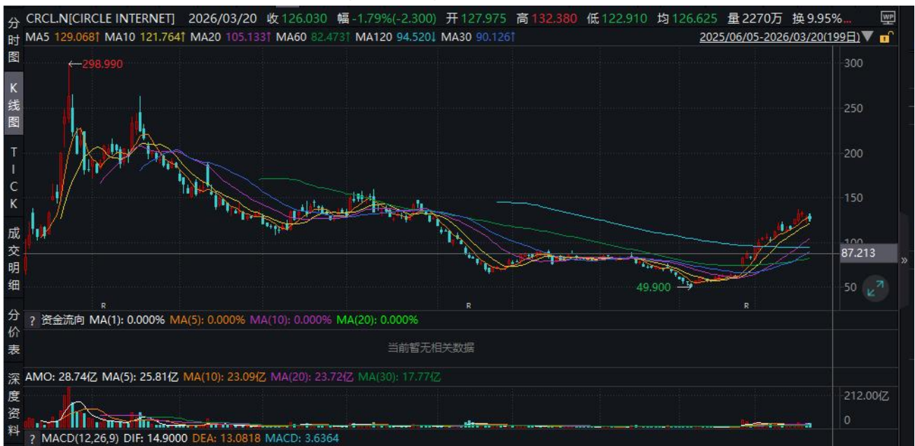
圖五：Circle(CRCL.US)公司過去一年股價表現情況

截至 2026 年 3 月 20 日 Circle( CRCL.US )收盤價報 126.03 美元，2026 年年初至今累計漲幅達 58.93 %，過去一個月漲幅超 51.04%，創上市以來歷史新高。總結來說，本輪股價強勢上漲，是基於業績基本面、宏觀監管、估值重構、交易層面四大因素共振的結果，其中 AI 智能體支付的長期敘事，是推動估值中樞上移的核心邏輯。