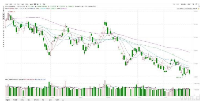
恒生指数 (2023/04/13-2023/10/31)