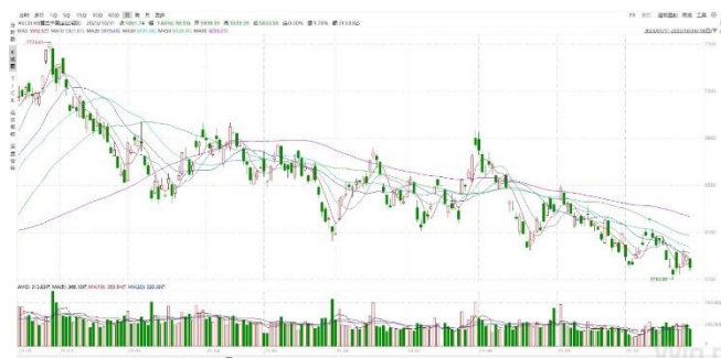
恒生中国企业指数 (2023/01/11-2023/10/31)