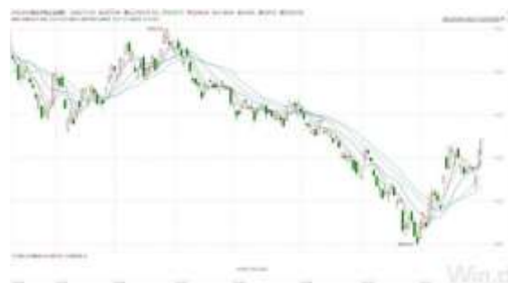
恒生中国企业指数 (2022/04/07-2022/11/30)