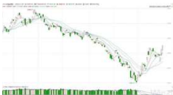
恒生指数 (2022/05/19-2022/11/31)